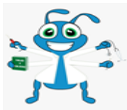
MAPA DE PROCESOS E.S.E HOSPITAL SAN FRANCISCO