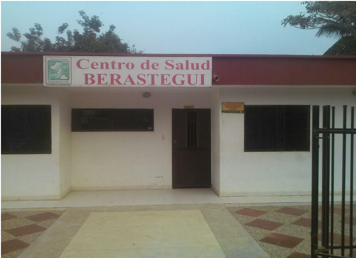
Imagen N° 2: Panorámica de la entrada principal del Centro de salud Berasategui.