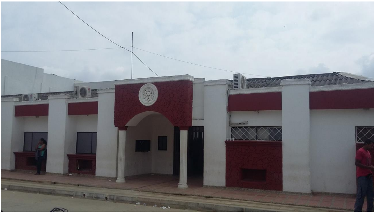
Imagen N° 1: Panorámica de la entrada principal de la E.S.E Hospital San Francisco